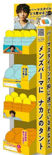
取扱い店舗専用什器

メンズパーマのスタイリングは簡単で楽しいというメッセージを込めたキービジュアルを起点に、取扱い店舗での専用什器やWEB CM動画などパーマスタイリングに悩む男性が自分ゴト化するような販促展開を実施します。同時に「グリース 4」「ワックス 5」のトライアルサイズを数量限定発売することで、「タント」を手にとっていただきやすい環境をつくります。